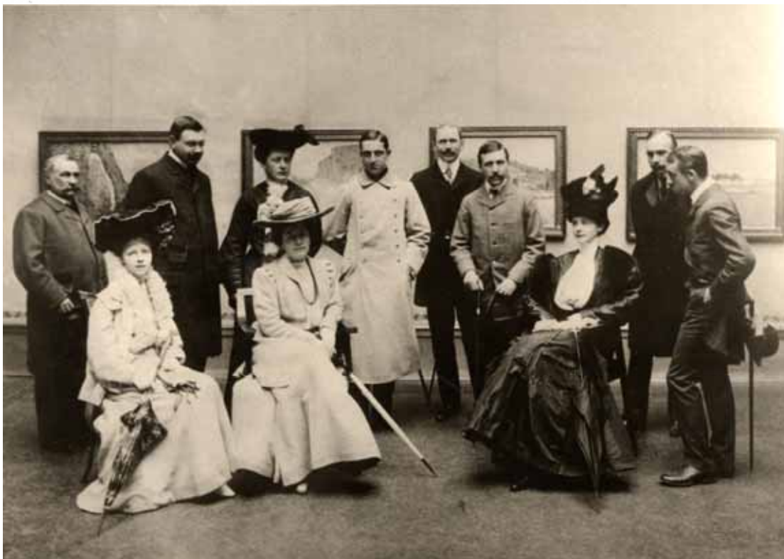
„Eröffnung der Monet-Ausstellung, Weimar am 29. April 1905“.

von Weimarer Betrieben vollständig ausgestattet