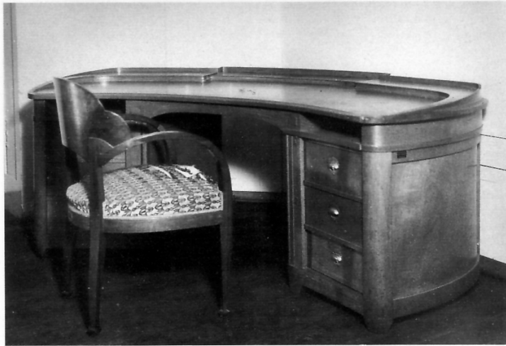
Schreibtisch 1903 und Sessel um 1908 Entwurf Henry van de Velde Hersteller Firma Scheidemantel Weimar