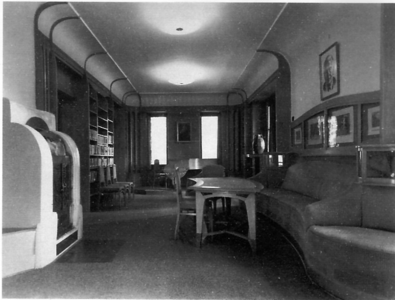
Les- und Vortragzimmer im ehemaligen Nietzsche-Archiv Weimar 1903 nach Entwürfen von Henry van de Velde

von Weimarer Betrieben vollständig ausgestattet