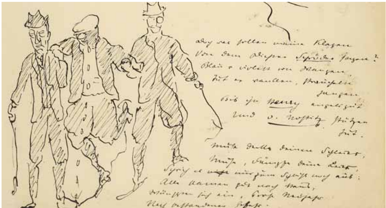
Band V „Henry van de Velde und Oswald von Nostitz stützen Rudolf Alexander Schröder beim Abstieg vom Wendelstein“ Gedicht und Zeichnung von Rudolf Alexander Schröder