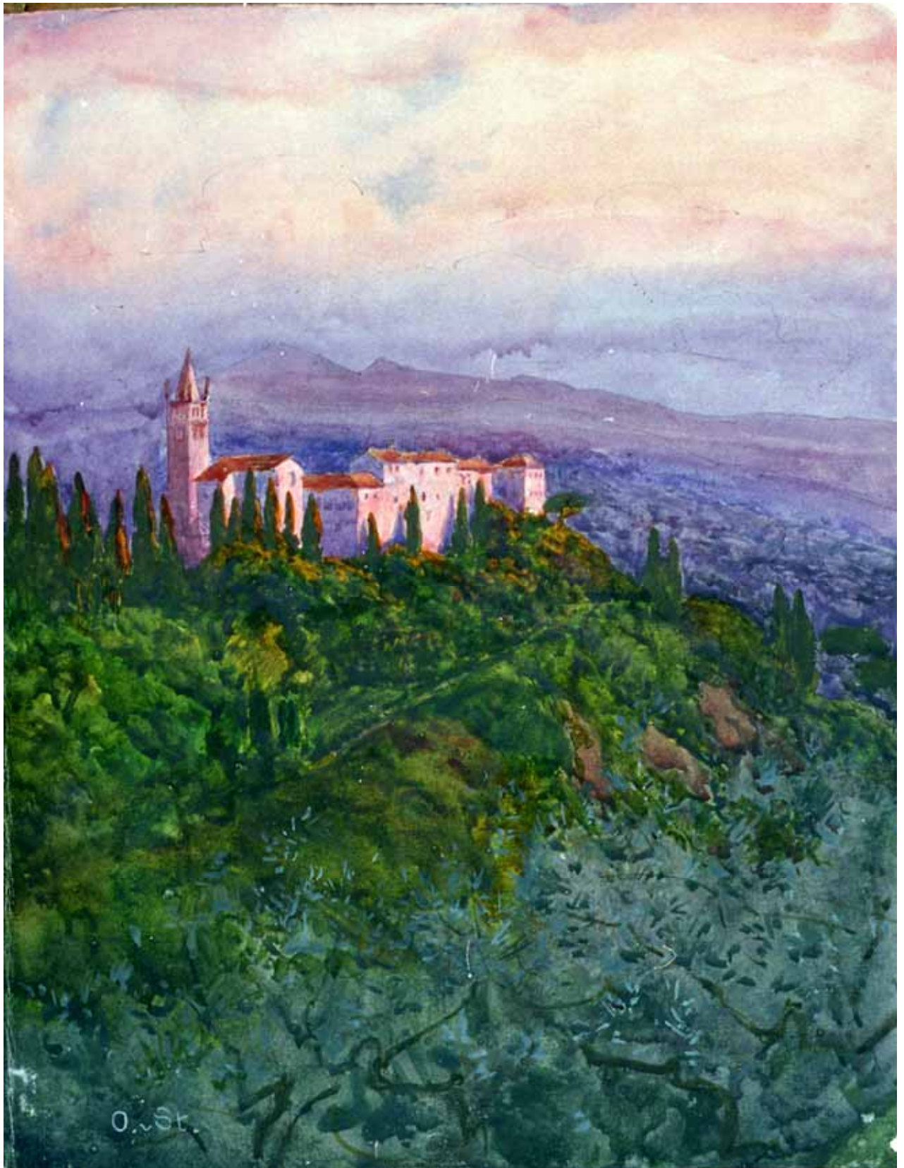
Gästebücher Band III