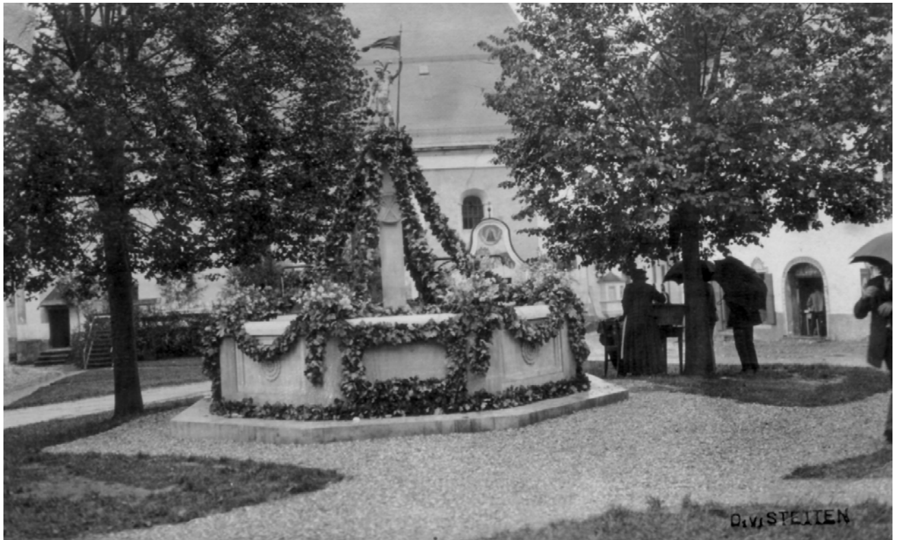
Brunnenweihe des Dorfbrunnens zur Erinnerung an Jan von Wendelstadt im Juli 1912