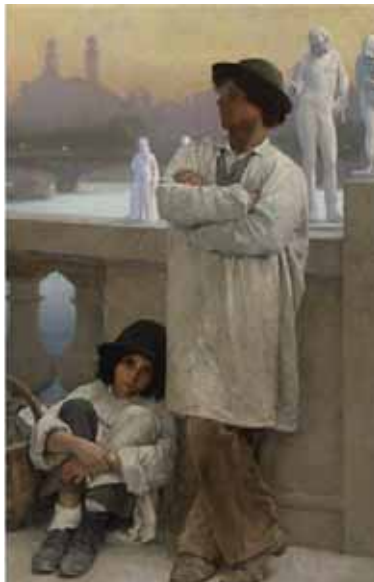
Junger Bildhauer auf einer Pariser Brücke, Alter Trocadero in Distanz

Dressler Kunsthandbuch: Bayerischer Michaelsorden,