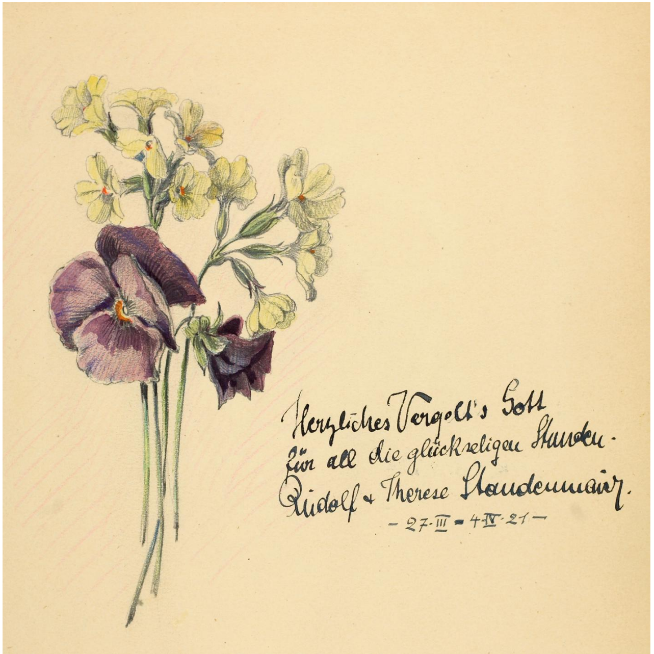
Gästebücher Bd. VI