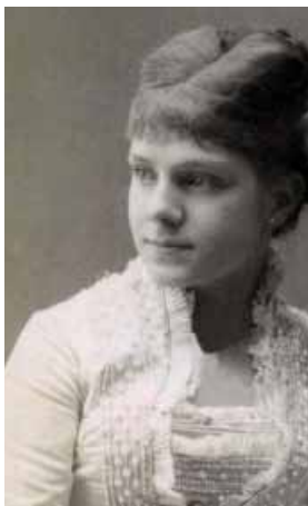
María Eulalia von Spanien (1864–1958) ∞ 1886 Anton von Montpensier (1866–1930)

María de la Paz von Spanien (1862–1946) ∞ 1883 Ludwig Ferdinand von Bayern (1859–1949)