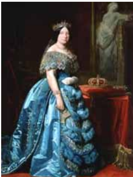
Isabella II. (Gemälde von Federico de Madrazo y Kuntz)