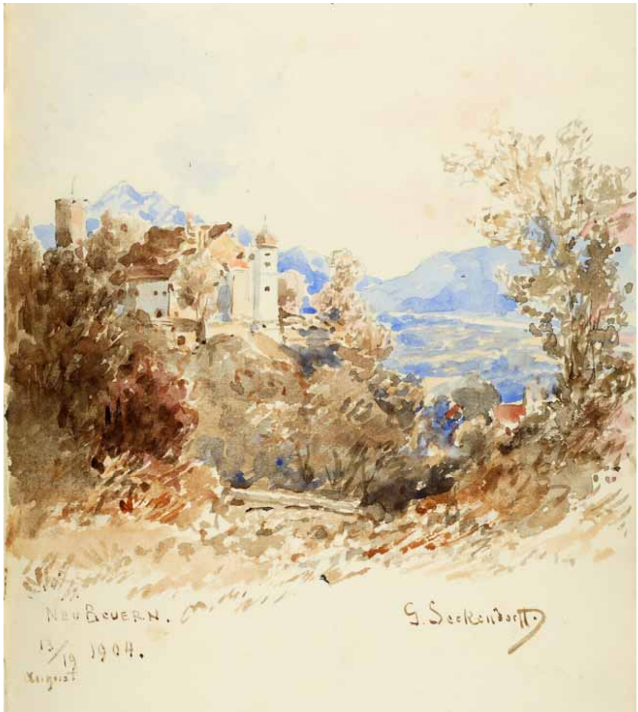
Gästebuch Band IV