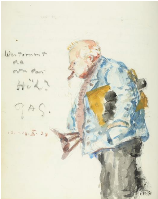
Gästebücher Schloss Neubeuern Bd. VII

26. Januar 1878 in Bremen † 22. August 1962 in Bad Wiessee