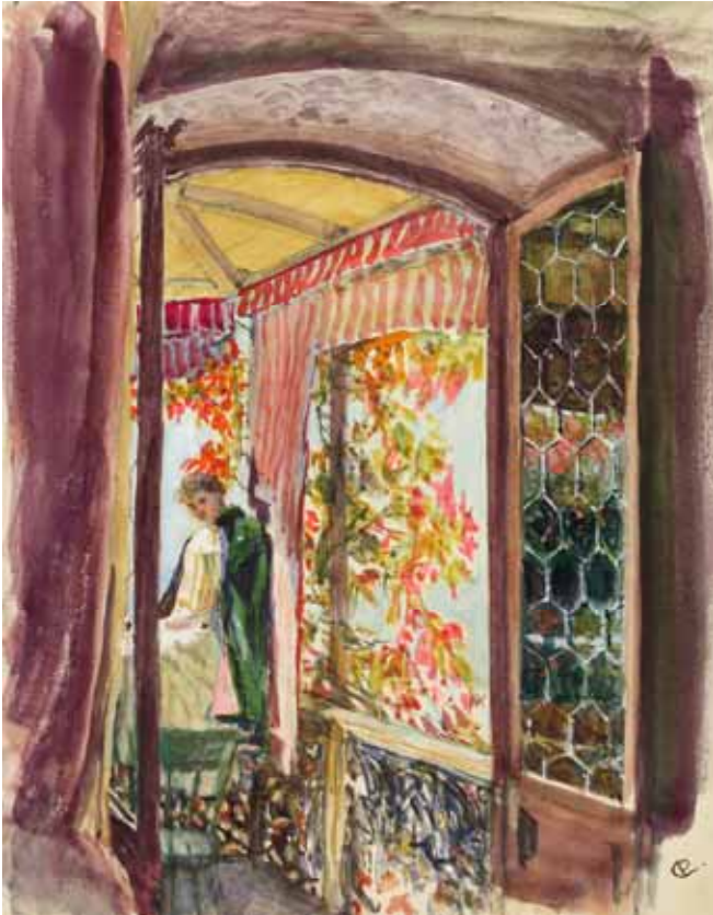
Gästebücher Band III „Julie am Fenster“