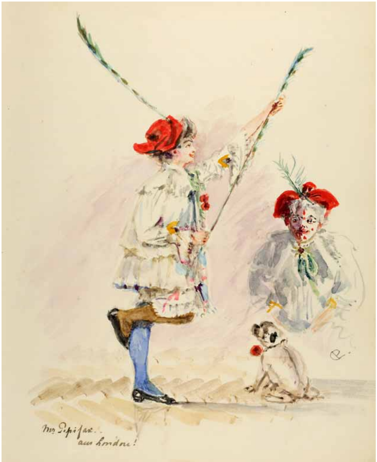
Gästebücher Band III