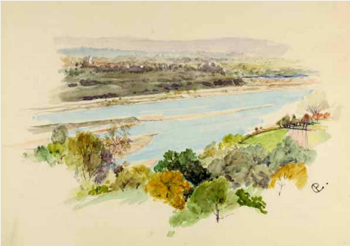
Gästebücher Band III „Der Inn mit Blick nach Raubling“