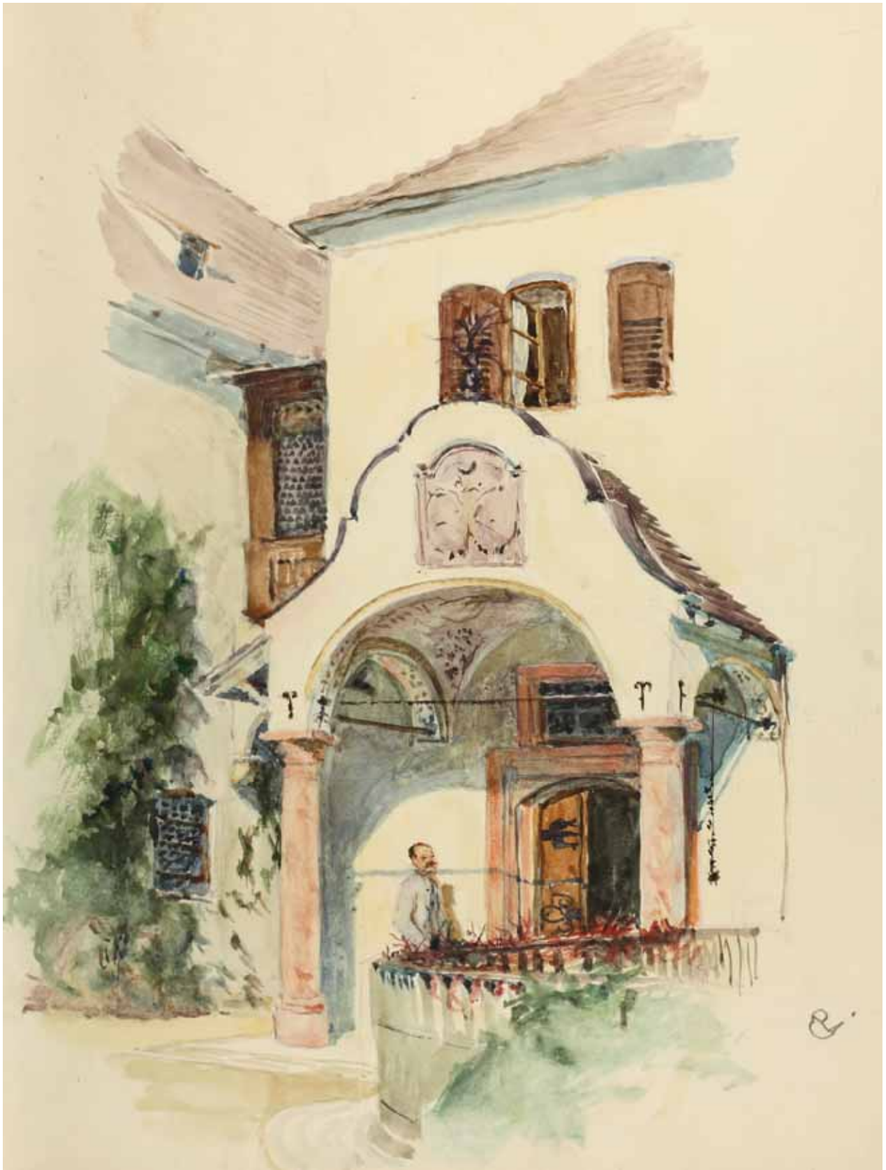
Gästebücher Band III „Alter Haupteingang auf der Südterrasse Schloss Neubeuern“