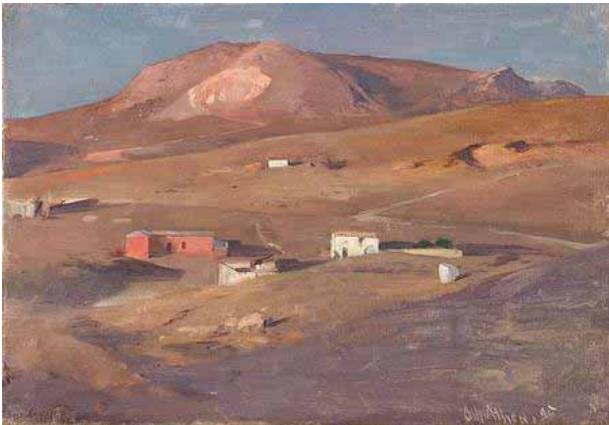
Ludwig von Löfftz , Abend bei Athen, 1895

http://www.kunstkopie-server.de/motive/Ludwig-von-Loefftz/Die-Beweinung-Christi-durch-Maria-Magdalena.-1006509.html