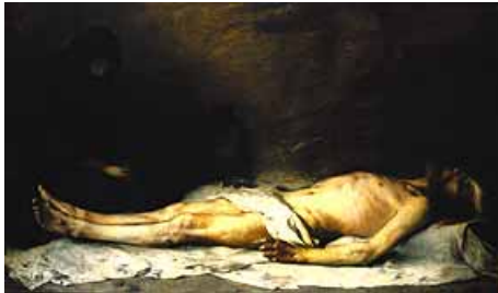
Stil: Pointillismus/ Neo-Impressionismus Kunstwerk: Die Beweinung Christi durch Maria Magdalena. Jahr: 1883

Darmstadt, Hessisches Landesmuseum: » Studienkopf «, 1874; » Heimkehr von der Jagd «, 1875. - Frankfurt a. M., Städelsches Kunstinstitut: » Bäuerin im Sonntagsstaat «, 1892. - München, Neue Pinakothek: » Die Beweinung Christi durch Magdalena «, 1883; » Felsenlandschaft «, 1890; » Interieur in Halberstadt «, um 1890. - Stuttgart, Staatsgalerie: » Erasmus von Rotterdam «, 1882.