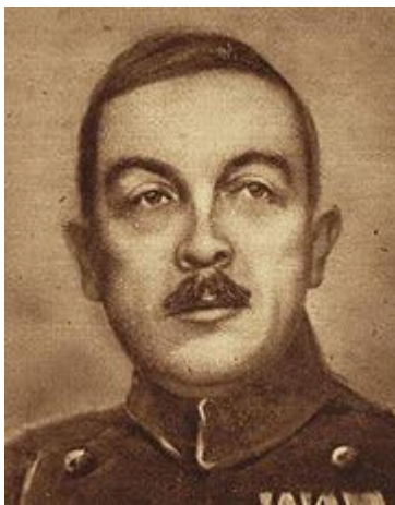
Richard von Kühlmann

Aufenthalt Schloss Neubeuern: 7. Oktober 1893 / Johannitag 1895