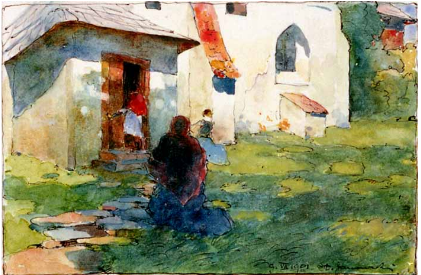
Gästebuch Band IV