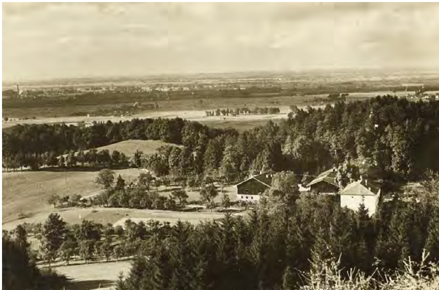
Gut Hinterhör mit Blick ins Rosenheimer Land