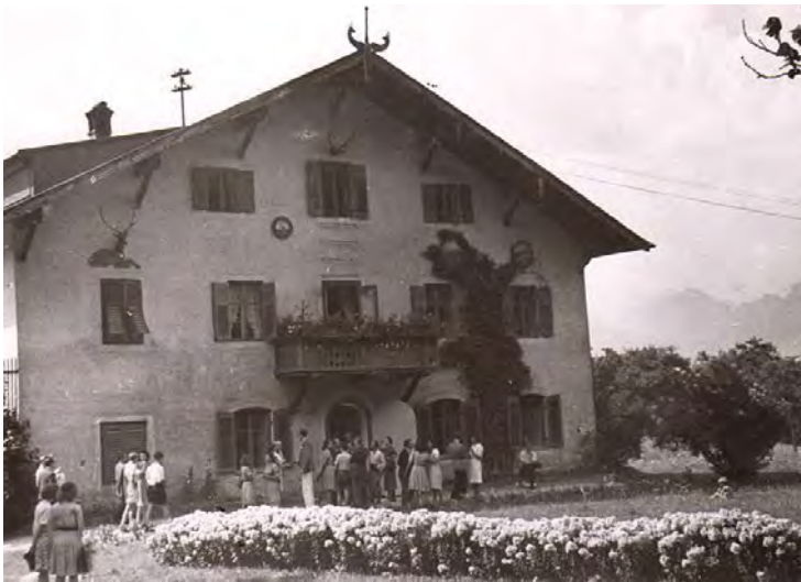
Gut Hinterhör bei Altenbeuern mit den Tagungsteilnehmern im Juli 1947