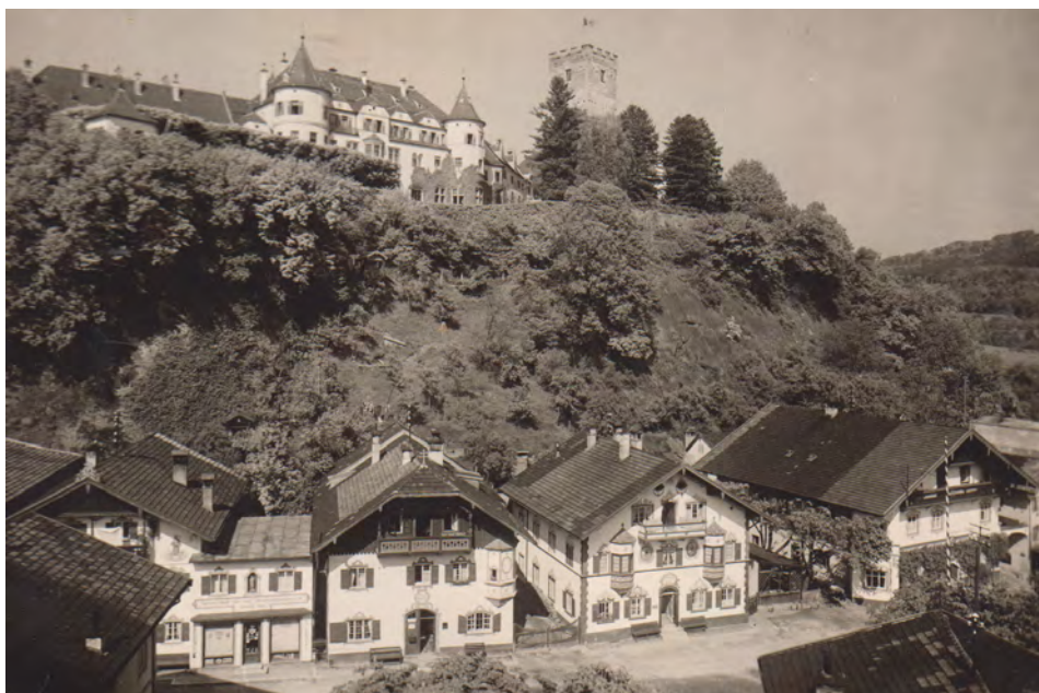
Postkarte Schloss und Markt Neubeuern 20er Jahre