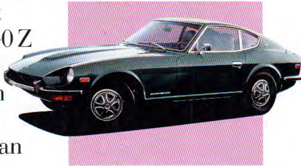
Fast & Furious: Der Datsun 240Z

Amerikanische Muskeln, italienische Feingliedrigkeit, fast so schnell wie ein Porsche. Bis heute gehört der Datsun 240 Z zu den imponierendsten Sportwagen aus Japan