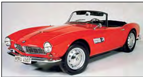
BMW 507, entworfen von Albrecht Graf Goertz

1940 wurde Goertz in die US Army einberufen und leistete fünf Jahre lang seinen Dienst an der pazifischen Front. Nach seiner Rückkehr ins zivile Leben 1945 lernte er Raymond Loewy kennen. Loewy war zu dieser Zeit der herausragende Vertreter des Industriedesigns und verhalf Goertz zu einem Studium am Pratt Institute in Brooklyn. Anschließend stellte er ihn als Junior Designer in seiner Studebaker-Entwicklungsabteilung ein, wo Goertz zusammen mit einem Kollegen das erfolgreiche Facelift des Studebaker Champion entwirft - die so genannte "Bullet Nose". Nach zweieinhalb Jahren trennten sich die Wege von Goertz und Loewy . Goertz eröffnete 1953 schließlich sein eigenes Design- Studio: Goertz Industrial Design, Inc. New York.