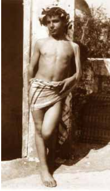
Sizilianischer Jüngling um 1900