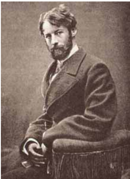
Wilhelm von Gloeden 1891

29. Oktober 1886 / 6. – 19. Juli 1890 / 24. November 1890 / 16. November 1893 / 3. Dezember 1898 / 15. September 1899 / 25. September 1899