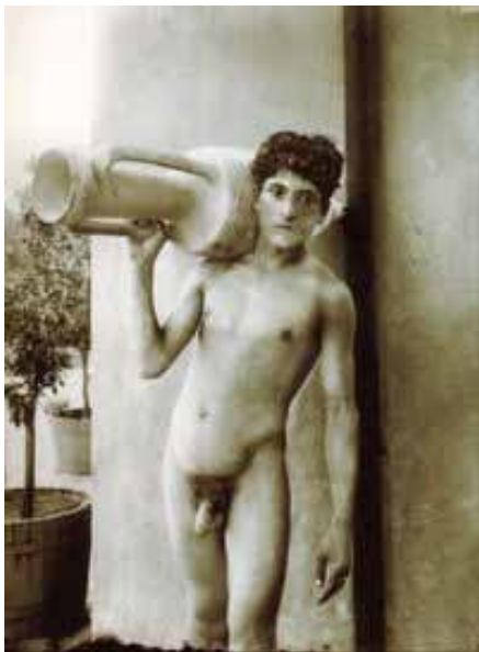
Akt mit Amphore, um 1900

Er seinerseits fand sich in einem Italien, das ein mythisches Ideal der Antike wieder aufleben ließ: "Die Lektüre von Homer, von Theokrits Gedichten in Sizilien regten meine Phantasie an. Felsen und Meer, Berge und Täler erzählten mir von arkadischen Hirten und vom Poliphem" . Auch das unverkrampfte Verhältnis der Bevölkerung zur Nacktheit (damals waren Kinder oft nackt in der Öffentlichkeit zu sehen) mag für Gloeden eine Erlösung von der deutschen Körperfeindlichkeit und Prüderie gewesen sein.