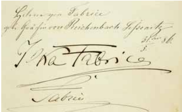
Gästebücher Bd. I