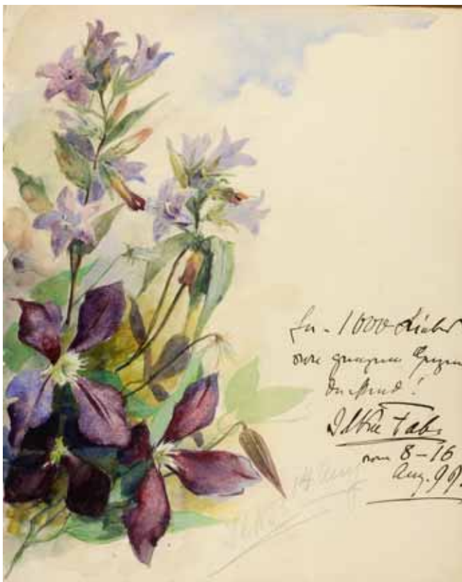
Gästebücher Band III