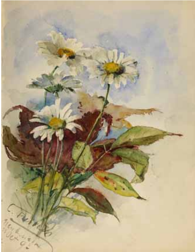
Gästebücher Band II