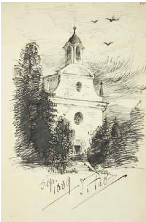
Gästebücher Band I „Schlosskapelle „