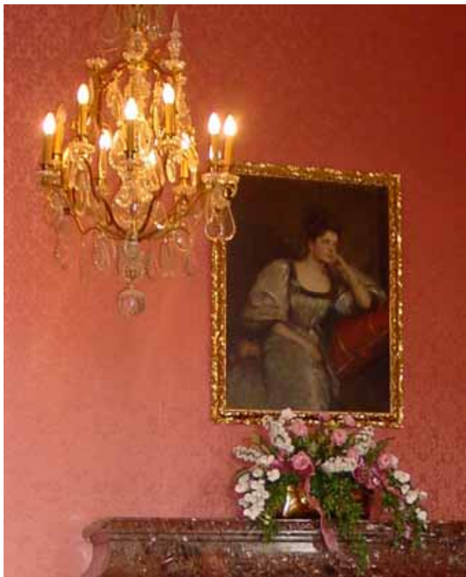
Portrait Julie Baronin von Wendelstadt sig. Carl Freibach Schloss Neubeuern Festsaal

http://de.wikipedia.org/wiki/M%C3%BCchner_K%C3%BCnstlerinnenverein