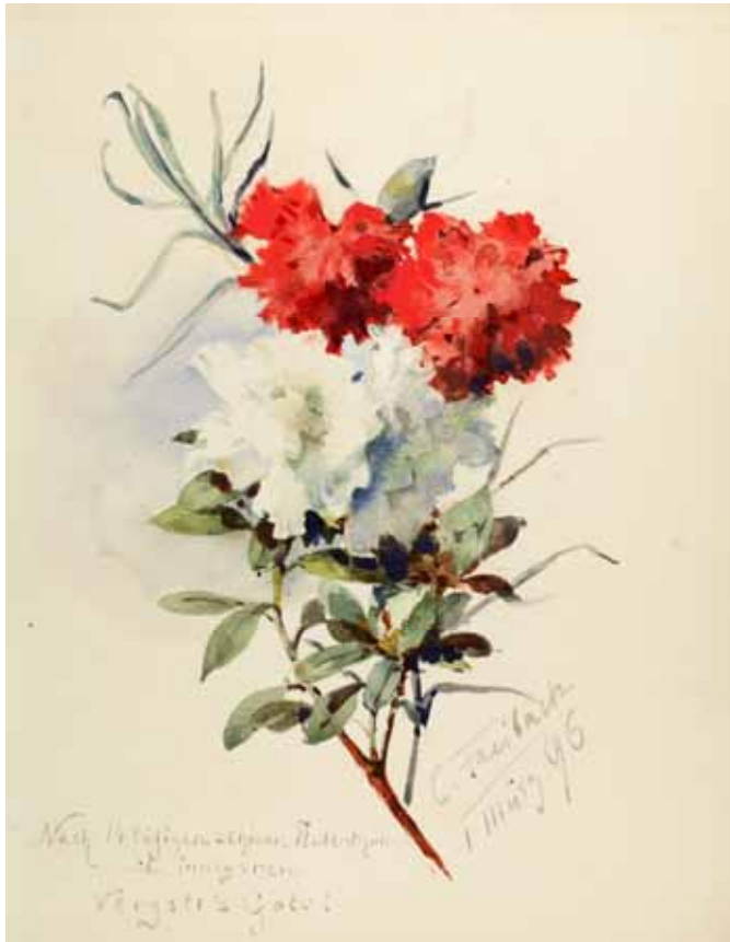
Gästebücher Band II