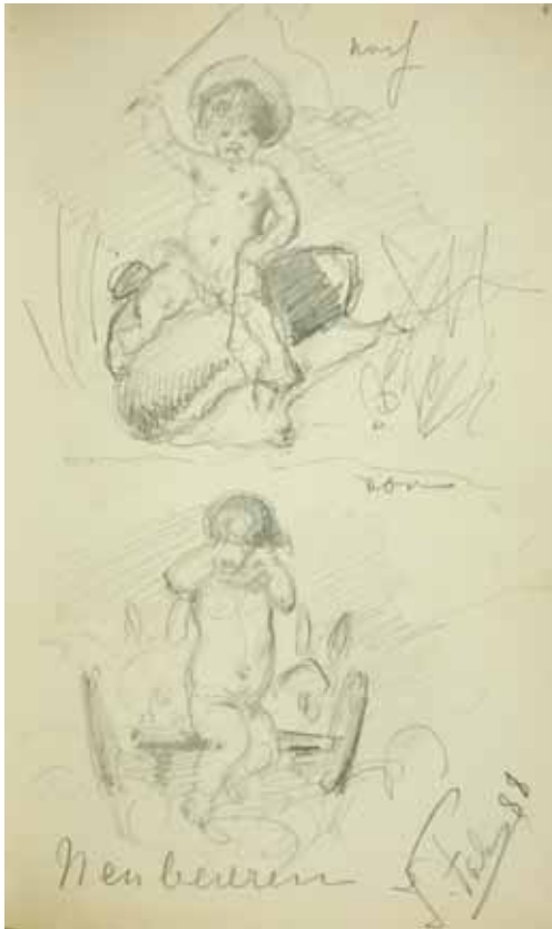
Gästebücher Band I