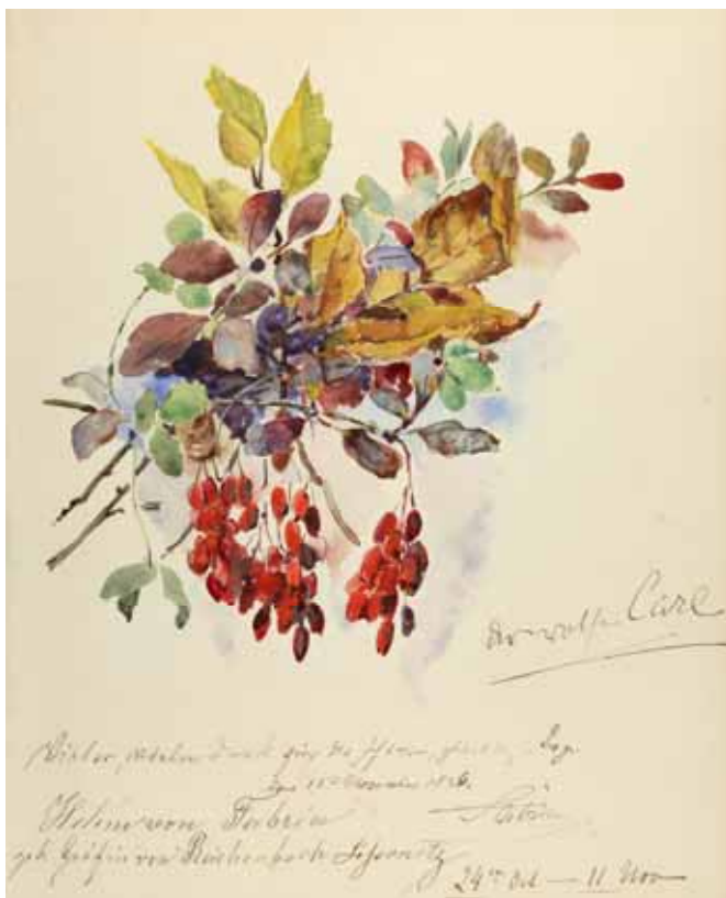
Gästebücher Band II