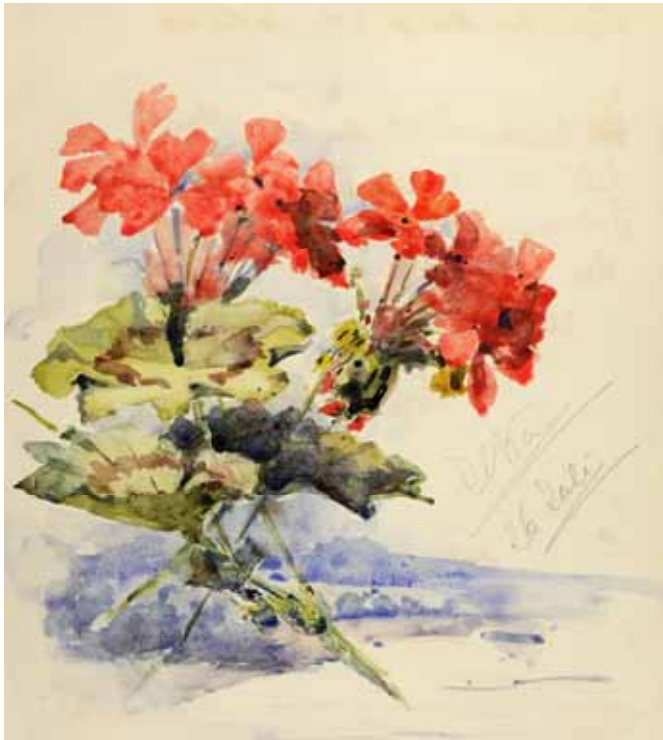
Gästebücher Band III