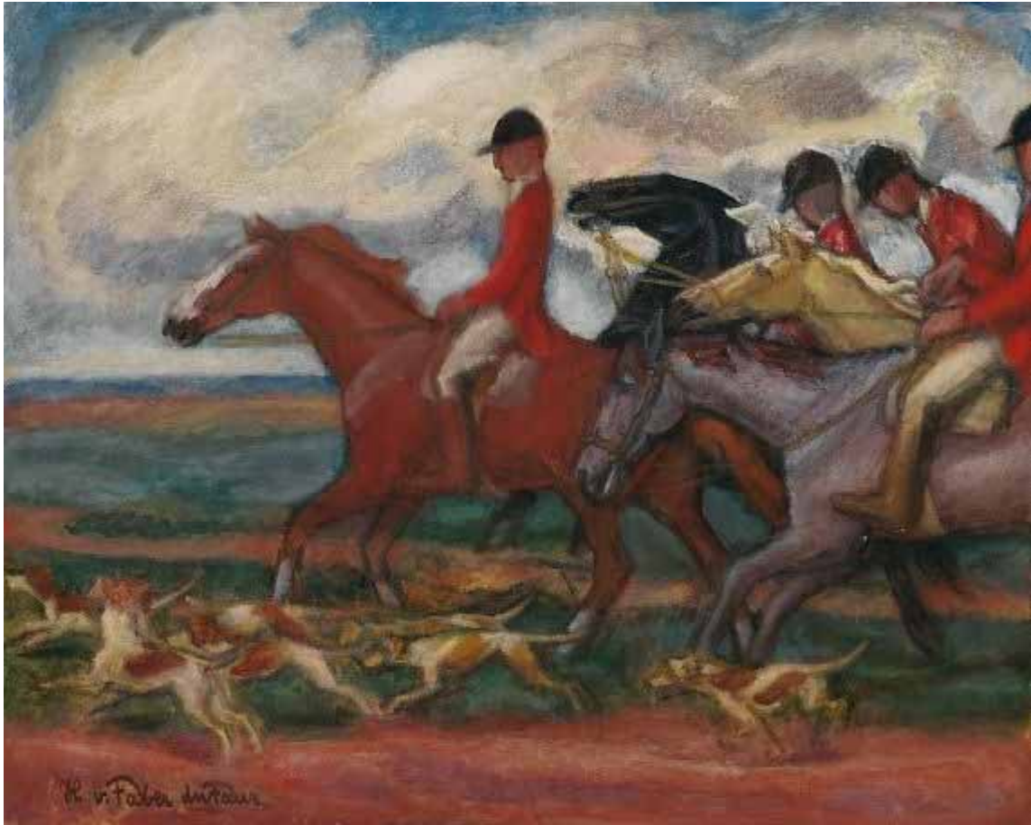
„Jagdreiter“ Schloss Nymphenburg