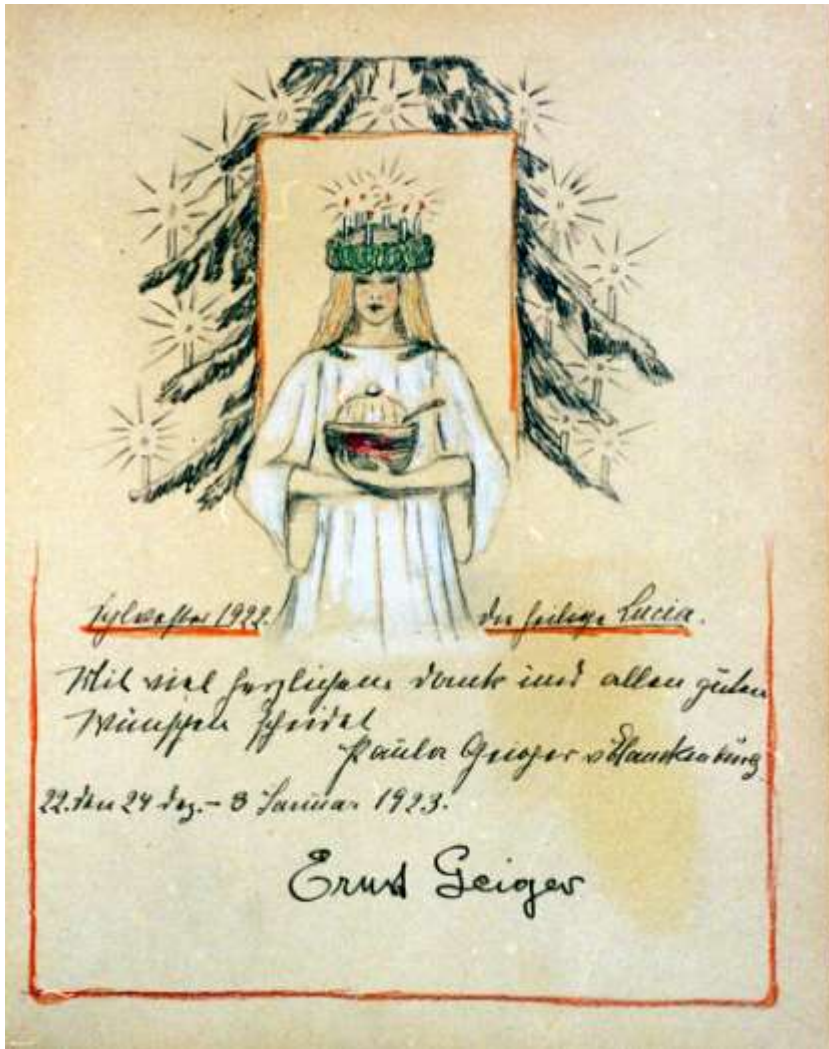
Gästebücher Bd. VI Sif Engelhard als Heilige Lucia

Clovis Engelhardt 26-28 Sept. und 3-5 Okt. 24 4/5. Okt. 1925 Ab nach Brasilien Stimmung Hei man vor! Dem glücklichen Gast in Neubauern schlägt uns eine schwere Stunde: die des Abschieds! 26 Sept. - 5 Okt. 1925 Sif Engelhardt