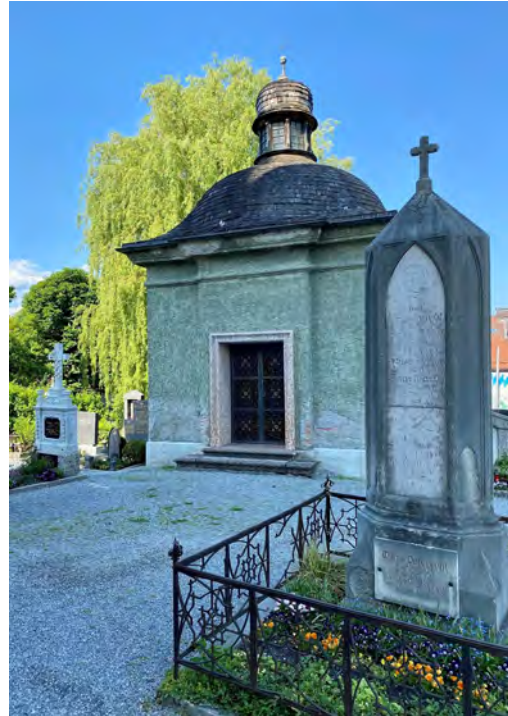
Das Grab auf dem Friedhof von Altenbeuern