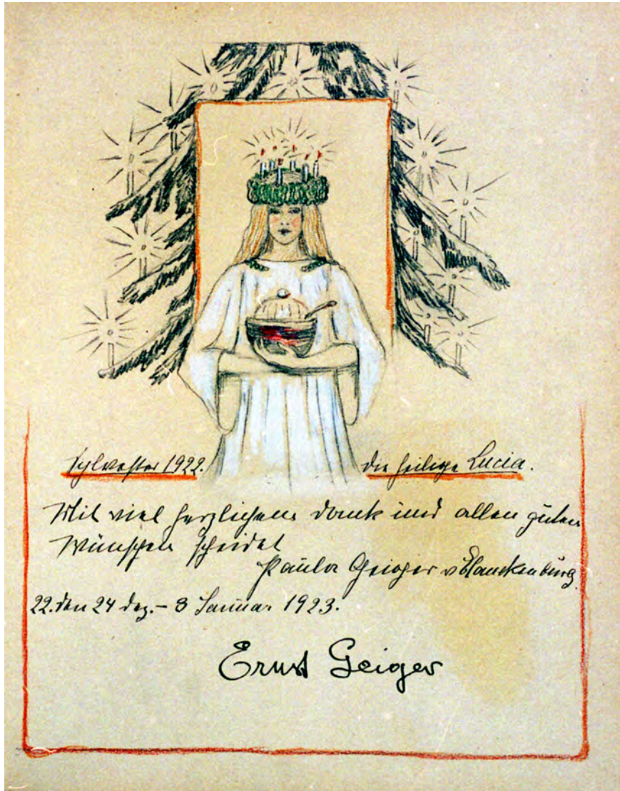
Gästebücher Bd. VI Sif Engelhardt als Heilige Lucia

Alexis Engelhardt 26-28 Sept. und 3-5 Okt. 25 4/5. Okt. 1925 Ab nach Brasilien Thuringia Adieu! Dem glücklichen Gast in Neubauern schlägt nur eine schwere Stunde die des Abschieds! 26 Sept. - 5 Okt. 1925 Sif Engelhardt