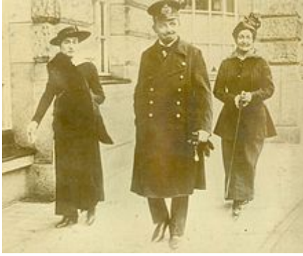
Nikolaus Graf zu Dohna-Schlodien vor dem Esplanada Hotel in Berlin

Nikolaus Graf zu Dohna-Schlodien war einer von nur zwei deutschen Offizieren des Ersten Weltkriegs, die die höchsten militärischen Auszeichnungen der fünf wichtigsten deutschen Länder erhielten: den preußischen Orden Pour le Mérite, den bayrischen Militär-Max-Joseph-Orden, den Sächsischen Militär-Sankt-Heinrichs-Orden, den Württembergischen Militär-Verdienstorden und den Militär-Karl-Friedrich-Verdienstorden des Staates Baden. Die Kommandanten und Besatzungen der Hilfskreuzer erhielten den Beinamen „Piraten des Kaisers“, damit waren die drei Hilfskreuzer SMS Möve , SMS Wolf unter dem Kommando von Fregattenkapitän Karl August Nerger , und SMS Seeadler unter Kapitänleutnant Felix Graf von Luckner gemeint.