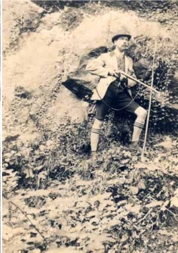
auf der Jagd am Heuberg