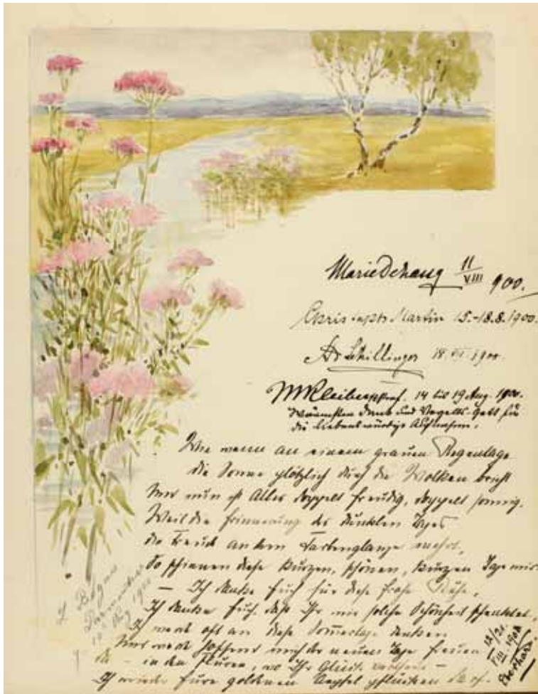
Gästebücher Band III