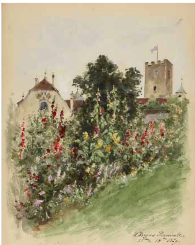
Gästebücher Band II „Ostbau Schloss Neubeuern mit Turm“