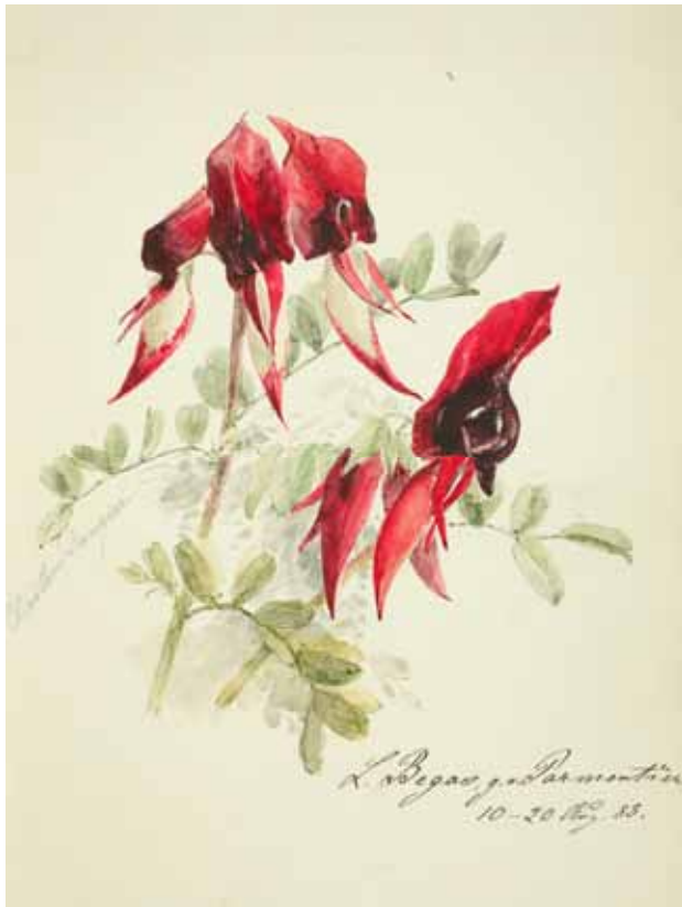
Gästebücher Band I