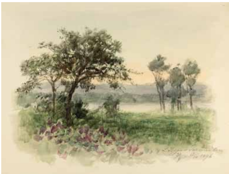
Gästebücher Band III