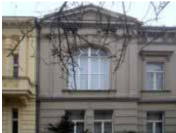
Atelierfenster in der Genthiner Str. 30i