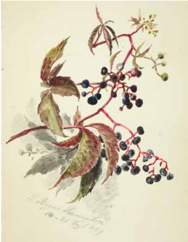
Gästebücher Band I