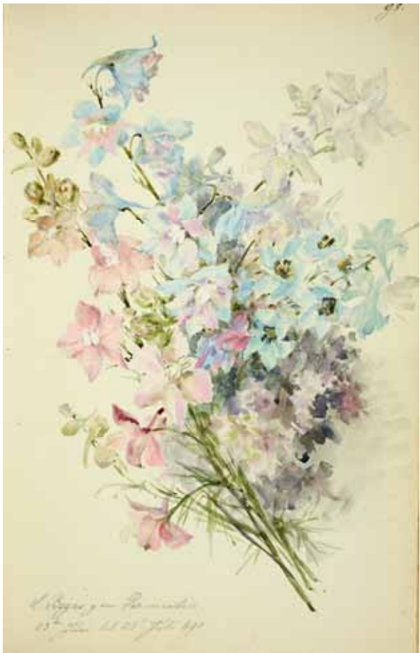
Gästebücher Band I