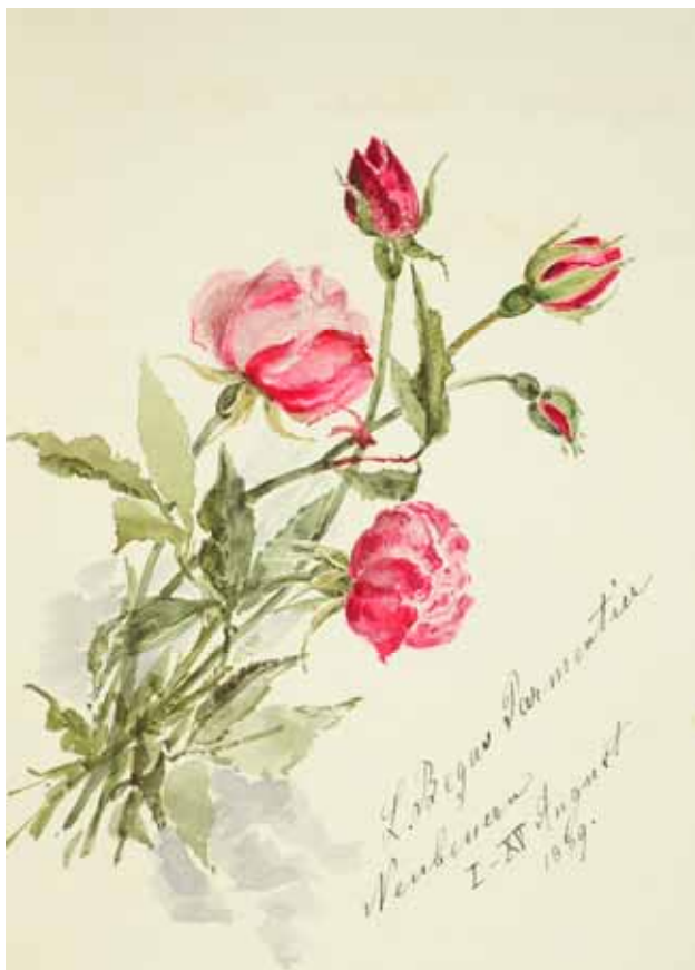
Gästebücher Band I