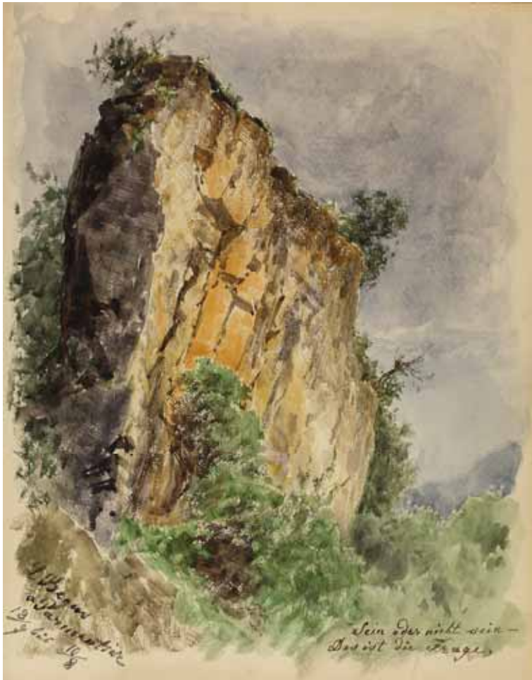
Gästebücher Band II „Felsen am Marktplatz Neubeuern“