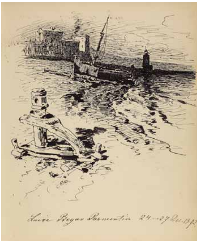
Gästebücher Band II