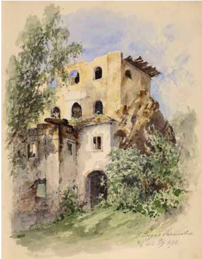
Gästebücher Band II