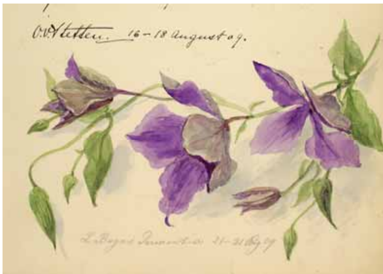
Gästebücher Band V