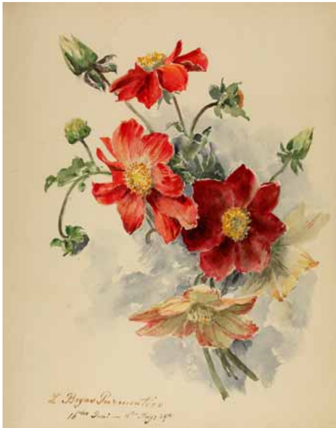
Gästebücher Band II