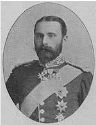
Heinrich Moritz von Battenberg

27. Juli 1882 / 5. September 1883 / 24. November 1889