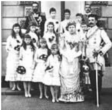
Hochzeitsbild von Prinz Heinrich und Prinzessin Beatrice

Bei der Hochzeit seines älteren Bruders Prinz Ludwig Alexander von Battenberg mit Prinzessin Viktoria Alberta von Hessen-Darmstadt lernte Heinrich Moritz 1884 die britische Prinzessin Beatrice , Tochter von Königin Victoria und deren Prinzgemahl Albert , kennen. Beatrice und Heinrich Moritz verlobten sich heimlich in Darmstadt. Zurück in Großbritannien war die Königin schockiert, sie wollte Beatrice auf keinen Fall erlauben zu heiraten, denn diese war ihre ständige Gesellschafterin und Sekretärin. Nach acht Monaten ständigen Streits über die Heirat stimmte Königin Victoria schließlich zu. Die einzige Forderung der Königin war, dass das Paar für den Rest ihres Lebens bei ihr leben solle. Beatrice war einverstanden, und Heinrich Moritz , der ein halbverarmter und nur halbstandesgemäßer Prinz war, sah keine Zukunft in der preußischen Armee und auch sonst keine bessere Alternative, also war auch er einverstanden.