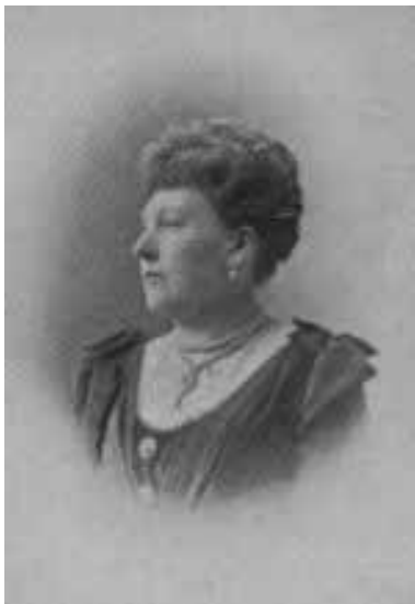
Beatrice von Großbritannien und Irland

Prinz Heinrich Moritz von Battenberg war ab 1889 Gouverneur und Kapitän der Isle of Wight.